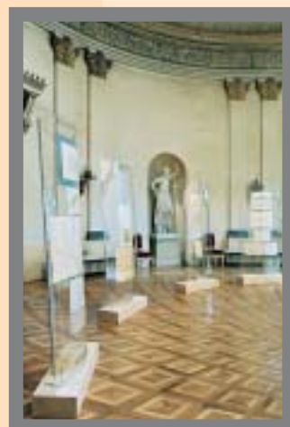
Anwendungen von PLEXIGLAS Gallery®